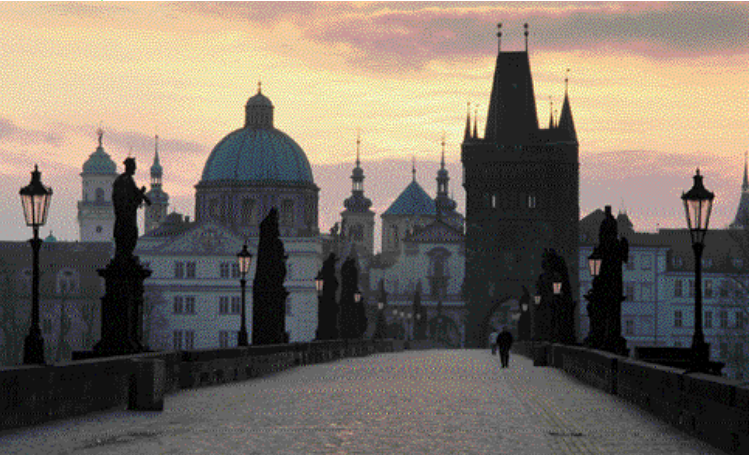
Karelsbrug [26] met zicht op Malá Strana