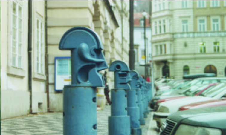
gietijzeren paaltjes op het Kleine Zijdeplein

Het kloosterterrein verlaten we bij het panoramapunt. Hier gaan we rechtsaf. We volgen het pad langs de perenboomgaarden. Bij de splitsing rechts aanhouden tot aan de mediterrane trap