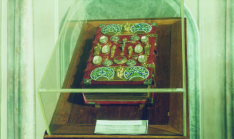
pronkstuk van het Strahov [17], een evangelie uit de 9 e eeuw