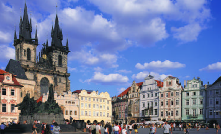
Jan Hus monument [35] op het Staroměstské náměstí

een fraai staaltje van gotiek. De 70 meter hoge toren is van later datum dan het Raadhuis zelf en kan beklommen worden.