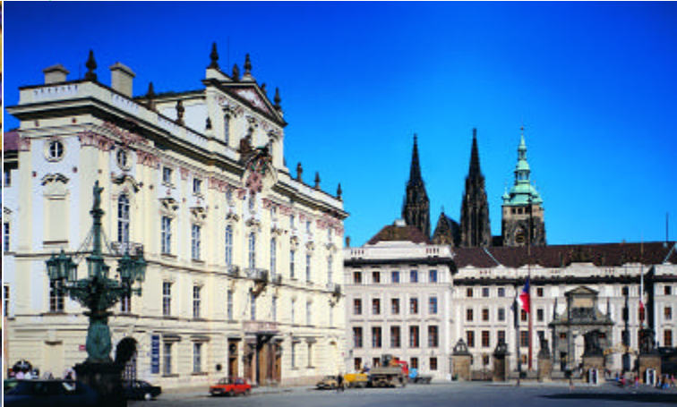
het Burchtplein met Burcht en Aartsbisschoppelijk paleis [9]

Het grote gebouw dat het burchthof omarmt is het Koninklijk Paleis [8]. Dit paleis was in 1618 het toneel van de beroemde '2 e Praagse Defenestratie'. Defenestreren is: het uit het raam gooien van een persoon, en hopen dat hij de landing niet overleeft. Hier betrof het twee koninklijk gezinde ambtenaren die door protestanten beentje werden gelicht. De éne bron beweert dat de twee defenestranten het hebben overleefd omdat ze op een mestvaalt landden, de andere zegt dat ze enkel een nat pak haalden in de slotgracht.