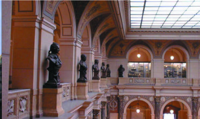
interieur van het Nationaal Museum [52]

De Tsjechische benamingen, zie ook kaart op middenblad: