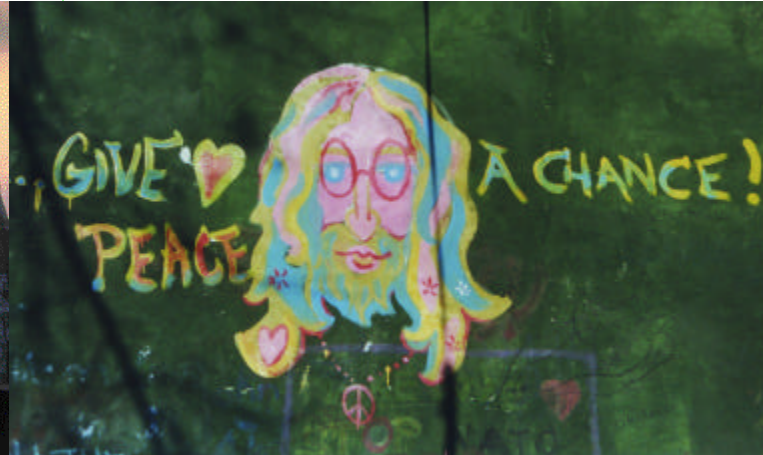
John Lennon graffitimuur [25]

Het Wallensteinpaleis [23] bevindt zich net achter dit plein. Voor de bouw van dit paleis in 1630 moesten zo'n 25 huizen wijken. Het paleis is ontworpen door Italiaanse architecten en is vooral groot. Interessanter is de tuin van het Wallenstein. Te bereiken via de straat Letenská. In de elegante tuin zijn replica's van beelden te zien van de Nederlandse beeldhouwer Adriaen de Vries. Onlangs is hij herontdekt en vergeleken met Michelangelo.