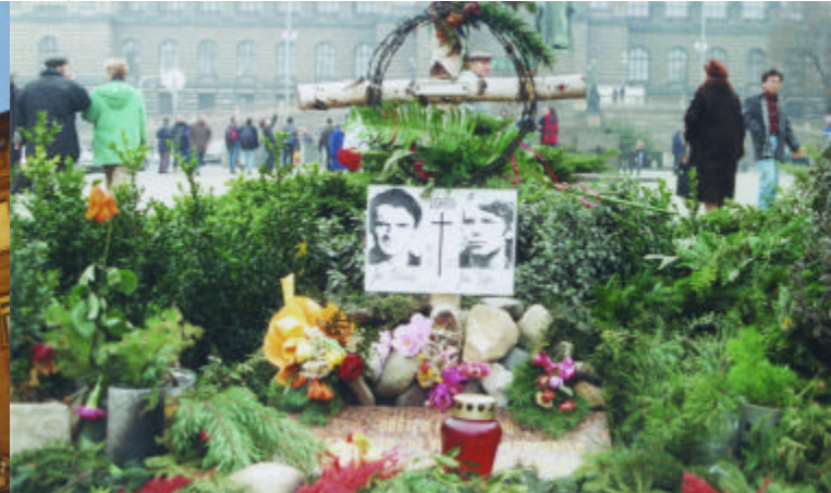
monument ter herinnering aan de Praagse Lente [50]

Zo mogelijk het bekendste hotel van Praag staat aan de linkerzijde: hotel Evropa [48] . Het werd in 1889 gebouwd en kreeg in 1904 zijn Jugendstil uiterlijk. Het carrouselachtig balkon geeft de entree een nostalgische grandeur. Bovenaan zien we drie vrouwen in gezelschap van een pauw, een typisch Jugendstilgevoel. Daaronder zien we allerlei versieringen