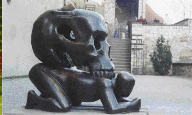
kunstwerk 'Parable with skull' bij de Zwarte Toren [3]

Op het platform valt een koperen kunstwerk uit 1994 van