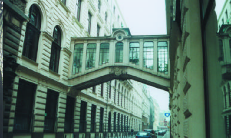
stenen 'luchtbruggen' [42] in zijstraat van Na prikope

De Kruittoren is verbonden met het schitterendste voorbeeld van Jugendstilbouwkunst in Praag. Het Obecní dum, het Representatiehuis [41], ook wel 'Repre' genoemd. Het is gebouwd tussen 1906 en 1911. De twee kunstenaars die we al eerder tegenkwamen hebben ook hieraan meegewerkt: Saloun en Mucha. Het Repre heeft een feestelijke voorzijde. Van boven naar beneden zien we de glazen koepel met daaronder waterval van versierselen. Het Repre heeft vijf zalen, waarvan twee op de begane grond. Links is het Kavárna, het café. De inrichting is Jugendstil in een rijke ingehouden vorm, alles harmonieert