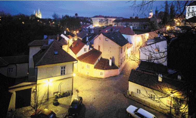
het aardige straatje Nový Svet 'by night'

In het plantsoentje in het midden van het plein staat de Mariazuil [11]. Deze is hier uit dankbaarheid geplaatst omdat Praag in de 18 e eeuw grotendeels gespaard is gebleven voor de pest. De naam van de kunstenaar: Brokoff. Eén van de bekendste barokbeeldhouwers van Praag.