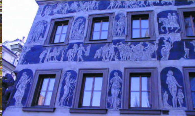
het renaissance hoekhuis 'De Minuut' [32]

De Karlova komt uit op een driehoekig pleintje: het Kleine Plein (Malé náměstí). Centraal staat hier de smeedijzeren pomp met fontein uit de 15 e eeuw. Opvallend is het neorenaissance pand van de Firma V.J. Rott [31]. Het pand is tot de nok toe beschilderd met Jugendstil-motieven. In dit geval de zogeheten vegetatieve, organische elementen. Langgerekt zodat het sier-