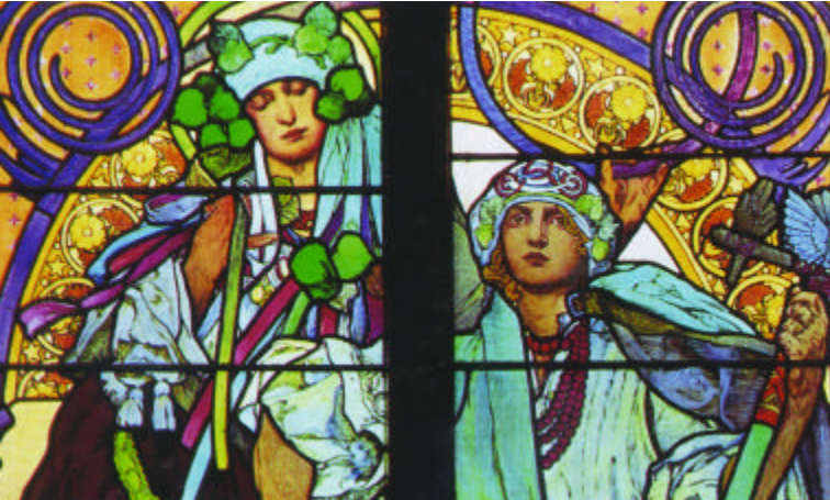
mozaïk van Mucha in de St. Vituskathedraal [7]

Wat opvalt aan de buitenkant zijn de steunberen hoog op het gebouw die de kapellen, het koor en het middenschip bij elkaar moeten houden. Een noviteit destijds. Dat moet je als architect ook maar weten te verkopen. Helemaal als de klant koning is. Het mozaïek boven een van de toegangspoorten beeldt het laatste oordeel uit. In de kerk maken de haast eindeloos repeterende bogen van het dakgewelf, en de imponerende afmetingen van het middenschip elke bezoeker klein. Een invloed van de 20 e eeuw zien we in de gebrandschilderde ramen. Eén ervan - links - is gemaakt door de Tsjechische Jugendstilkunstenaar Alfons Mucha. Rechtsachter in de kerk bevindt zich in een afgeschermd ruimte de kapel van de heilige koning Wenceslas, in Tsjechië Václav genoemd. Zijn tombe wordt omringd door prachtig 14 e eeuws mozaïk en 16 e eeuwse schilderijen. In het achterste gedeelte van de kerk zijn onder andere het St. Vitusaltaar, de relikwieënkapel en het hoofdaltaar te zien.