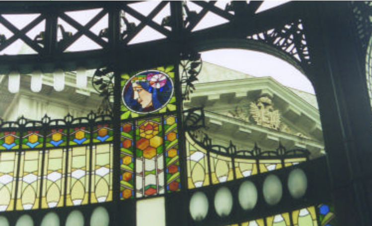
U hybernú gezien vanuit het Obecní dum [41]

Zwarte Madonna [39]. Dit kubistische huis uit 1915 van de architect Josip Gocar staat op de hoek rechts. Het kubisme was een kunststroming die omstreeks 1910 begon in de schilderkunst. Het is eigenlijk wel merkwaardig dat het kubisme zo weinig navolging heeft gekregen in de bouwkunst, terwijl die zich er toch bij uitstek voor leent. Het lijnenspel en de vlakverdeling doen zeer uitgebalanceerd aan. De enige versiering die Josip zich toestond waren de envelopjes boven de pilaren, en als toetje: twee zolders.