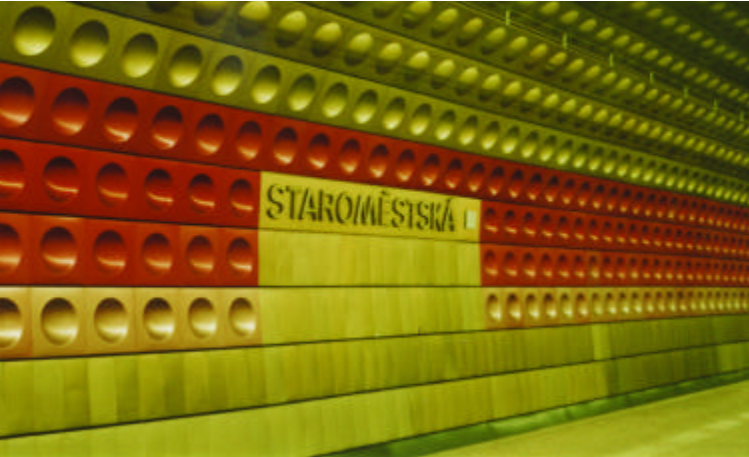
de Praagse metro is op zichzelf al een attractie

Praag, 'de Gouden Mijl'. Onze wandeling begint aan de oostzijde van de Praagse Burcht, Prazský Hrad, bij metrostation Malostranská [1] . Bij deze halte stoppen ook de stadsbussen en de trams. Met andere woorden: je bent hier niet alleen. De oude slottrap [2] , van 98 treden leidt naar de Burcht. Om in de Burcht te komen moeten we eerst de twee wachters passeren. In de negende eeuw was hier al een bolwerk. Deels van hout met een aardwal. In de eeuwen daarna is de Burcht geworden tot wat hij nu is: een ommuurd complex van paleizen, kerken en torens.