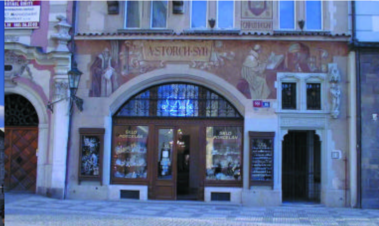
het Storchhuis [36] met Jugendstilbeschilderingen

Midden op het Staroměstské náměstí staat het Jan Hus monument [35]. Gemaakt door Ladislav Saloun. Deze Jugendstil-beeldengroep is in 1915 geplaatst ter gelegenheid van de vijfhonderdste sterfdag van deze kerkhervormer en volksheld. Johannes Hus werd ca. 1370 geboren. Als theoloog was hij fel gekant tegen de aflaatpraktijken en pleitte voor een Bijbelvertaling in de landstaal, het Tsjechisch. Dit bezorgde hem grote populariteit bij het volk en bracht hem op gespannen voet met de Paus en het koningshuis. Uiteindelijk werd hij in 1415 tot de brandstapel veroordeeld. In Tsjechië wordt Hus nog altijd gezien als symbool voor het zoeken naar de waarheid en de rechtvaardigheid.