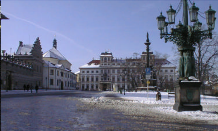
Mariazuil [11] met het Toscanepaleis [12] op de achtergrond

We slaan nu linksaf, het aardige straatje Nový Svet in, en weer links. Na de onderdoorgang ligt links het bedevaartsoord het Loretaheiligdom [15]. Het Loreta is in feite een gebouw om een gebouwtje. De sierlijke barokke buitenkant is ontworpen door de bekende architect Dientzenhofer, midden 18 e eeuw. Het binnen-