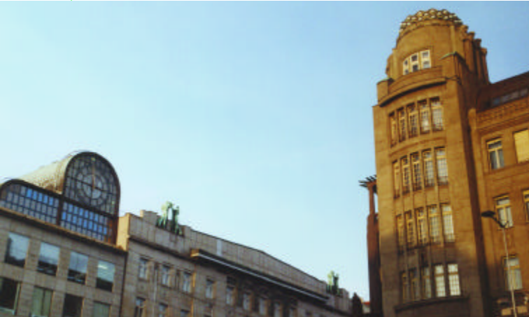
Koruna [46] had niet misstaan in de filmstad van Batman

Het Wenceslasplein is in feite een boulevard, zo'n 700 meter lang. Dit was het plein waar in 1989 de burgers van Praag demonstreerden tegen de toenmalige regering. De roep om verandering kwam van onder andere Charta '77, de katholieke kerk en het later ontstane Burgerforum. De Fluwelen Revolutie eindigde ermee dat de toneelschrijver Václav Havel op 29 december 1989 tot president gekozen werd.