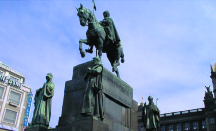
de heilige Wenceslas [51] te paard