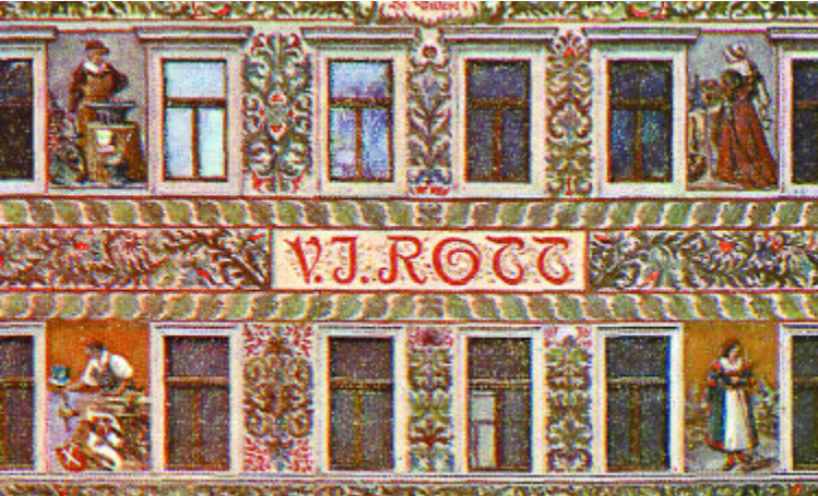
het neorenaissance pand van de Firma V.J. Rott [31]

de St. Salvatorkerk [28]. Onderdeel van het grote Clementium. Deze kerk heeft zich gehandhaafd door zo'n beetje alle stijlperiodes van 1600 tot 1800. Dus we zien renaissance plus nog wat barok en een enkel rococoversiering.